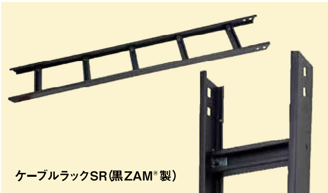
ケーブルラックSR(黒ZAM®製)